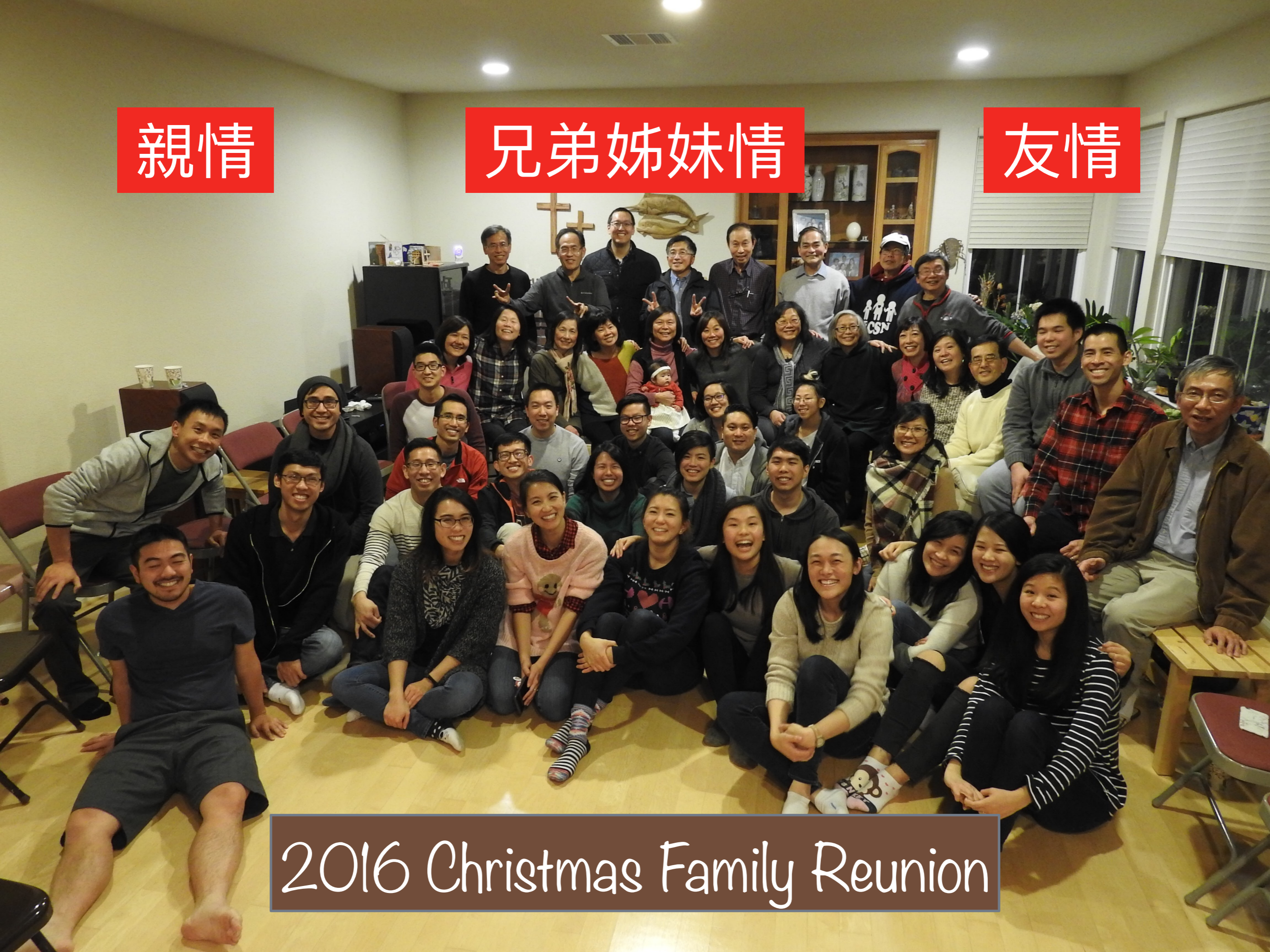
2016 Christmas Family Reunion