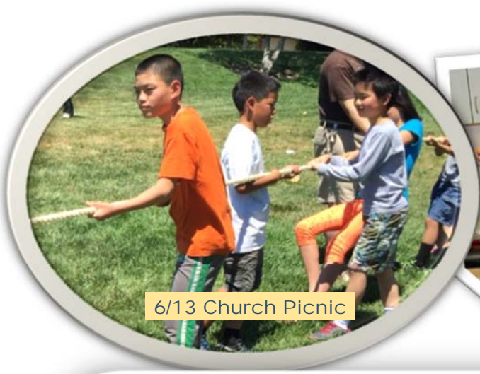
6/13 Church Picnic