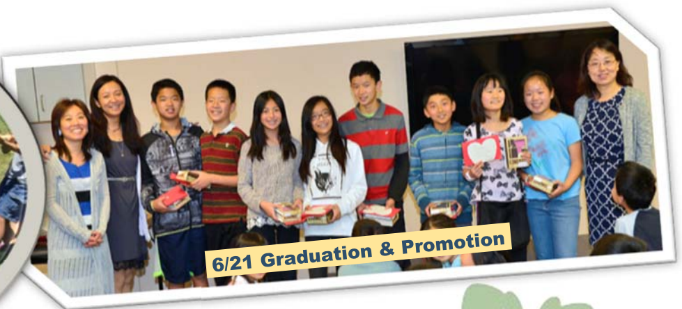
6/21 Graduation & Promotion