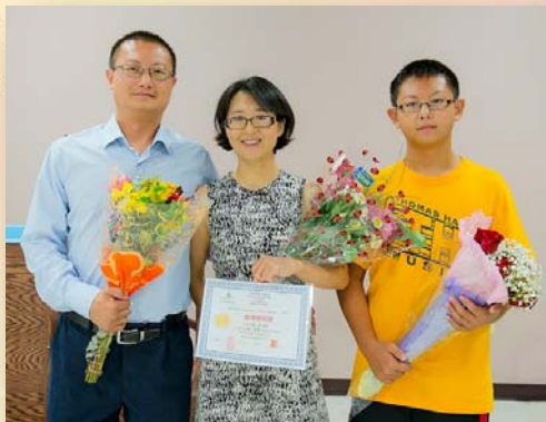
◆苑方受洗時與丈夫及兒子合照

2014 年 2 月 23 日，參加慕道班的最後一堂課，我們觀看了「十字架」的 DVD。在觀看期間，我被感動多次，但每次都克制住了自己即將流出的滿眶熱