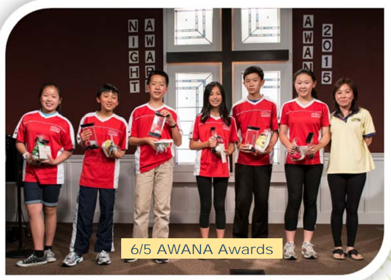
6/5 AWANA Awards