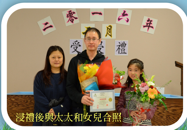
浸禮後與太太和女兒合照

我始終相信在世界的一端，如果有隻蝴蝶抖動一下翅膀，一定也會讓世界另一端的一個人打一個噴嚏。所以我們永遠都不要放棄愛、禱告和信心，因為它們會不斷地傳遞給每一個人。🏰