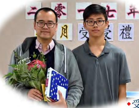
◆受浸後與兒子合照

在決志信主後，隨著學習神的話語，以及主內眾多弟兄姊妹的幫助，我逐漸察覺以前錯誤的人生觀和價值觀。雖然信主的時間還不長，靈命還需要成長，然而心中的煩惱、憂慮，慢慢減少了；讚美、平安、喜樂、包容漸漸增加，希望我能在基督裏成爲一個新造的人，有新的生命，活出基督的樣式，榮神益人。✠